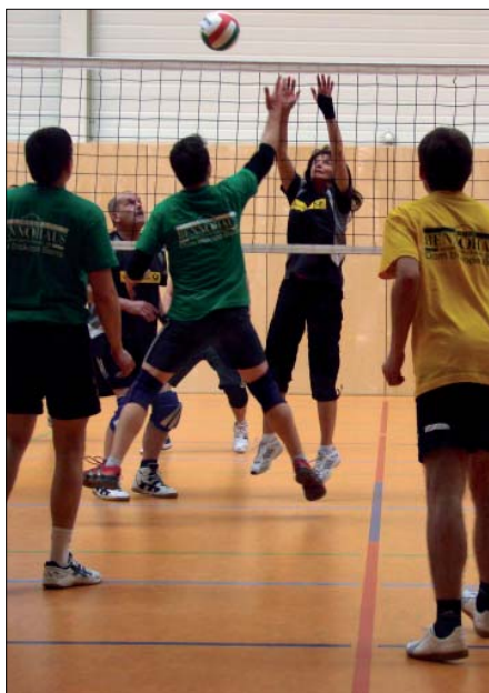
Wo kóždy bul je so horco wojowało.

Prěni raz přewjedžechu so sobotu, 27. februara 2010, hry najwjetšeho ludosportowego zarjadowanja w halomaj Serbskeho šulskeho a zetkawanskeho centruma w Budyšinje.