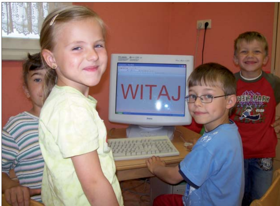
W pěstowarjach Serbskeho šulskeho towarstwa podpěruja wuknjenje serbsčiny z komputerom.