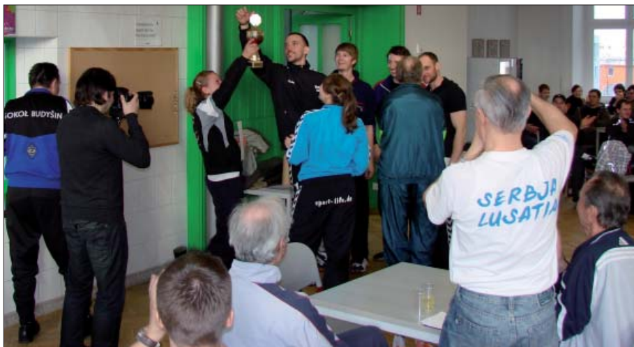
Hrajerjo mustwa „Přeceljo Smječkecy“ pokazuja hordže dobyćerski pokal.